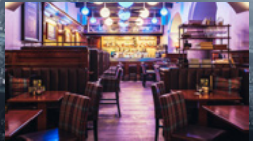
The Royal Dolores Munich Pub & Bar

Eintritt ist natürlich frei und wir freuen uns, wenn Sie in unseren vollklimatisierten Räumen Platz nehmen!